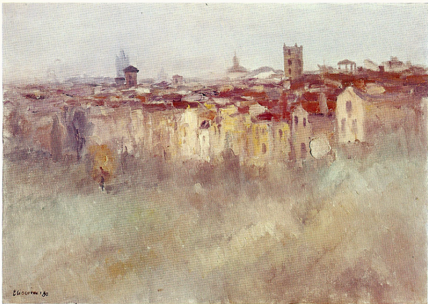
PAESAGGIO DI SIENA 70 x 50 cm.