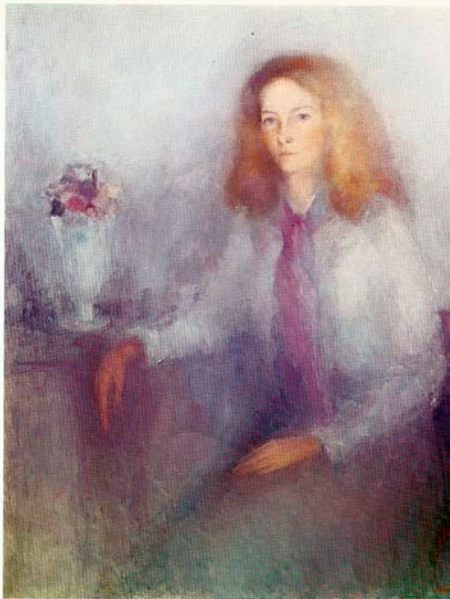
ILDIKO 120 x 100 cm.