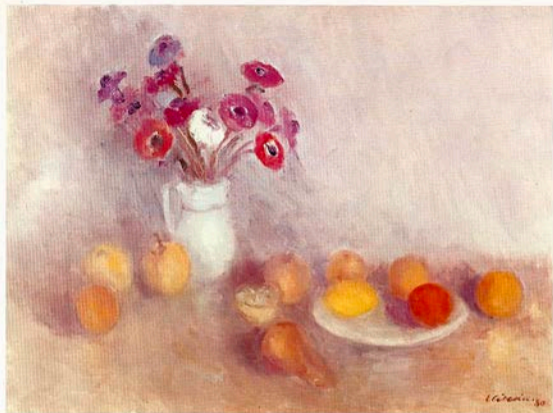
NATURA MORTA SU COLORI COMPLEMENTARI, 80 x 60 cm.