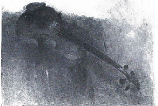
RITRATTO DI UN VIOLINO, 70 x 60 cm.