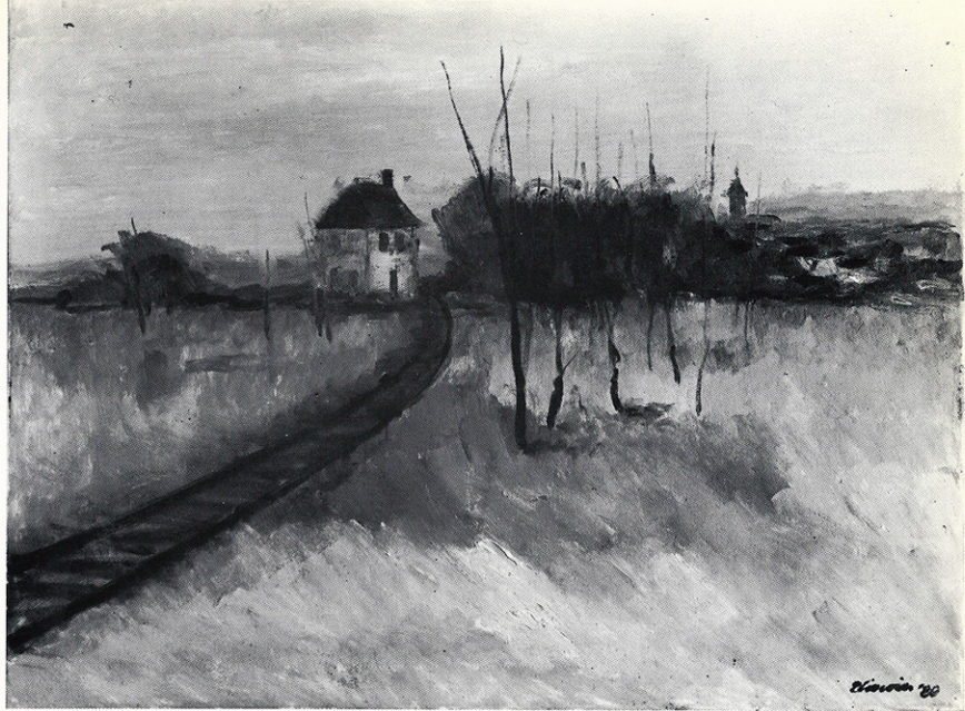
FERROVIA 80 x 60 cm.